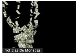
Noticias De Monedas Mayoría de monedas importantes en América Latina ganó frente al dólar en enero de 2022