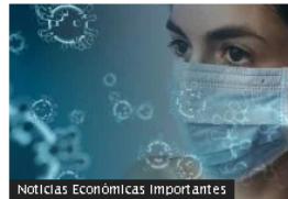
Noticias Económicas Importantes Covid en Colombia, enero 31: casos bajan por tercer día seguido