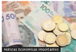
Noticias Económicas Importantes Pandemia costó $2,9 billones a aseguradoras en Colombia