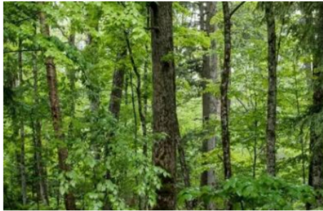
En marzo de 2021 el Grupo Ecopetrol se fijó el objetivo de "carbono neutralidad" o de "cero emisiones netas" para antes del 2050

El Grupo Ecopetrol informó que se sumó al movimiento "un billón de árboles" del Foro Económico Mundial que se enfoca en movilizar, conectar y empoderar a la comunidad global (gobiernos, empresas y sociedad civil) para conservar, restaurar y cultivar un billón de árboles para 2030.