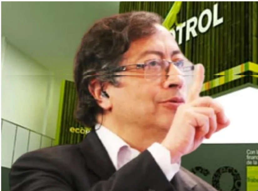
La postura de Petro no cuenta con el respaldo de un estudio de la matriz energética nacional

Este es un espacio de expresión libre e independiente que refleja exclusivamente los puntos de vista de los autores y no compromete el pensamiento ni la opinión de Las2Orillas.