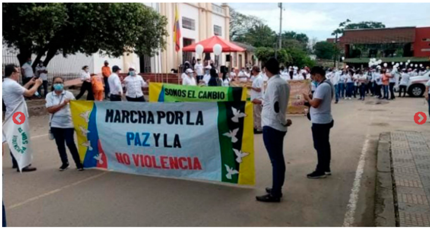
Los tibuyanos reclaman tranquilidad y paz a los grupos armados.