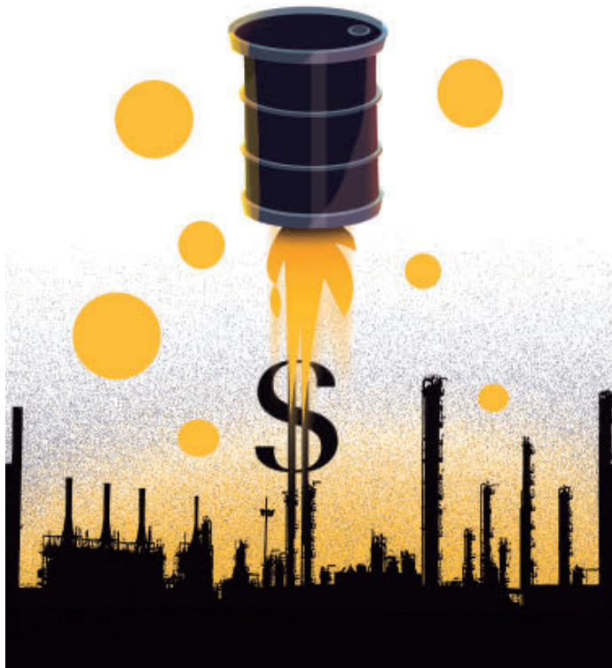
ILUSTRACIÓN ELENA OSPINA

Colombia, como país productor, se beneficia con este compor-