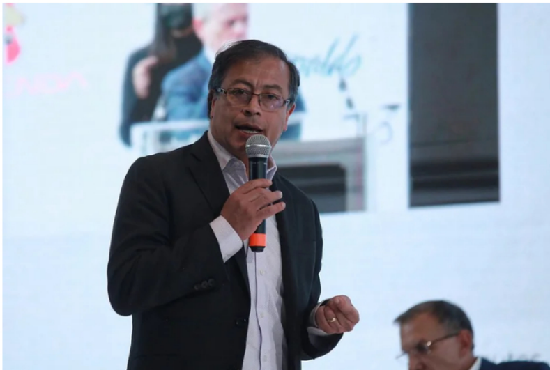
Gustavo Petro (Colprensa - Camila Díaz)

En las últimas semanas se han presentado debates políticos, en donde emergen múltiples dudas acerca de los candidatos. Aquí, los aspirantes buscan concretar distintas alianzas, sumar apoyo e incluso su retórica les puede jugar una mala pasada, en donde terminen siendo juzgados por el mismo pueblo. Uno de ellos es Gustavo Petro, quien desde su aspiración presidencial en el año 2018 fue víctima de su propio invento.