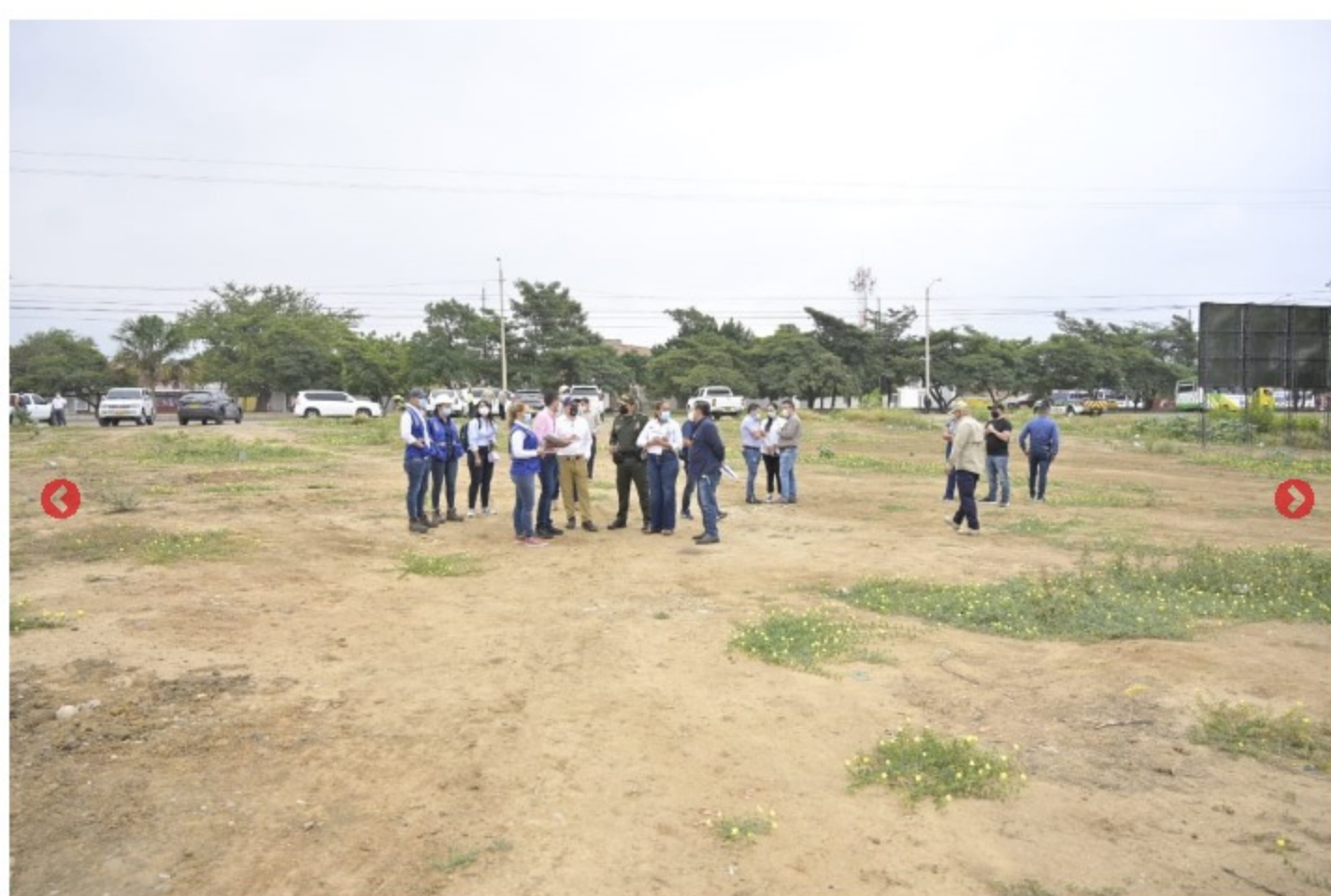
Aquí se construirá la estación de Policía de La Parada.

Gracias por valorar La Opinión Digital. Suscríbete y disfruta de todos los contenidos y beneficios en http://bit.ly/SuscripcionesLaOpinion