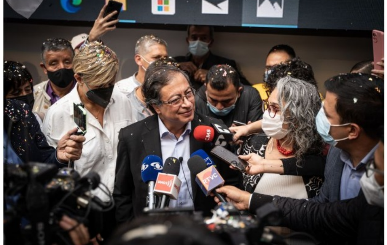
Gustavo Petro, candidato presidencial del partido Colombia Humana, habla con los medios de comunicación luego de registrar su candidatura en el Registro Civil Nacional en Bogotá, Colombia, el jueves 20 de enero de 2022.

Esos comentarios provocaron una liquidación a corto plazo del peso, aunque la moneda en general se ha comportado relativamente bien en los últimos meses. Petro dijo que no es responsable de las reacciones del mercado a los comentarios que hace antes de asumir el cargo.