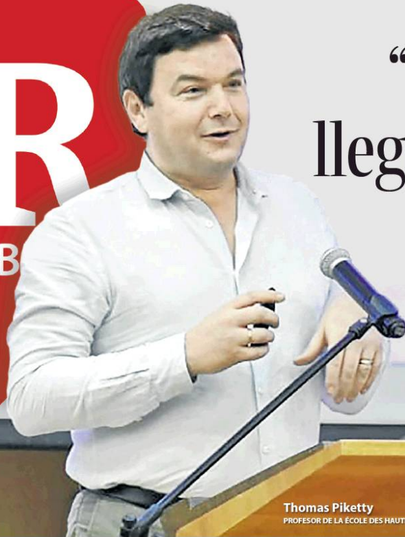
Thomas Piketty PROFESOR DE LA ÉCOLE DES HAUTES ÉTUDES