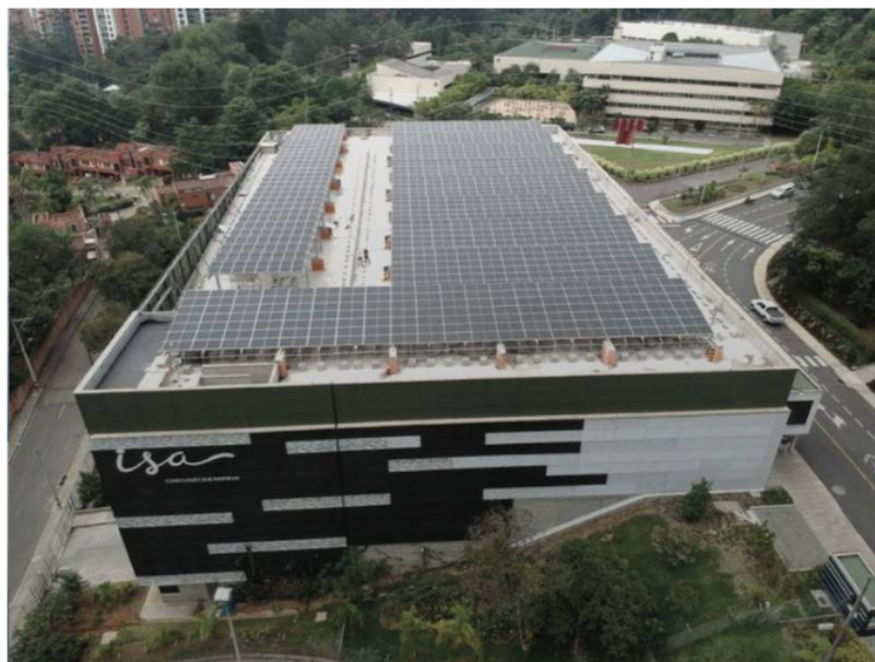
ISA inauguró en septiembre de 2020 una planta solar para la investigación sobre recursos energéticos distribuidos

Sin embargo, la Junta Directiva de la transportadora de energía nombró a manera de encargo al vicepresidente de la Unidad de Negocios de Transmisión de Energía