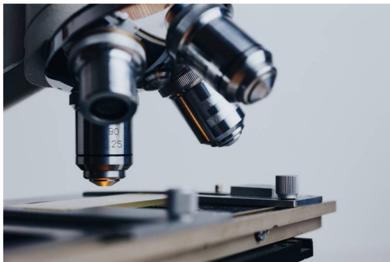
Ciencia - patentes. ¿Cuáles son los 5 extranjeros que más patentes lograron en Colombia en 20 años?

En las últimas dos décadas, el país ha concedido 13.328 patentes de invención en total, de los cuales el 88,4% se otorgó en la categoría no residentes