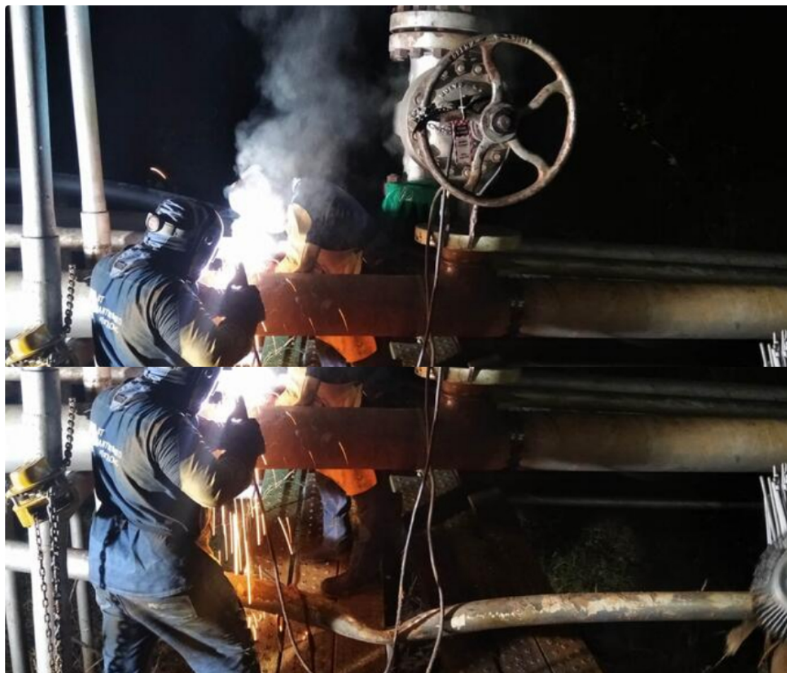
Ecopetrol - RCN Radio.

L uego de 24 horas de trabajo, por parte de los operarios de Ecopetrol , fueron reparadas y habilitadas las líneas de conducción que resultaron afectadas con las explosiones en el campo La Cira Infantas en Barrancabermeja.