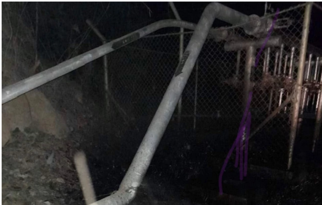
Explosivo contra la infraestructura petrolera

El atentado se presentó en el corregimiento El Centro, en Barrancabermeja. Por ahora las autoridades analizan la situación.