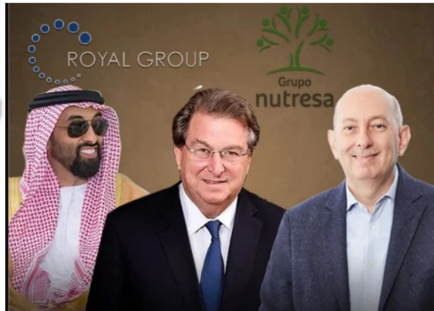
Duque va en la primera semana de noviembre a entrevistarse en Dubai con el príncipe heredero y cinco días después los Gilinski anuncian la OPA para quedarse con Nutresa

Este es un espacio de expresión libre e independiente que refleja exclusivamente los puntos de vista de los autores y no compromete el pensamiento ni la opinión de Las2Orillas.