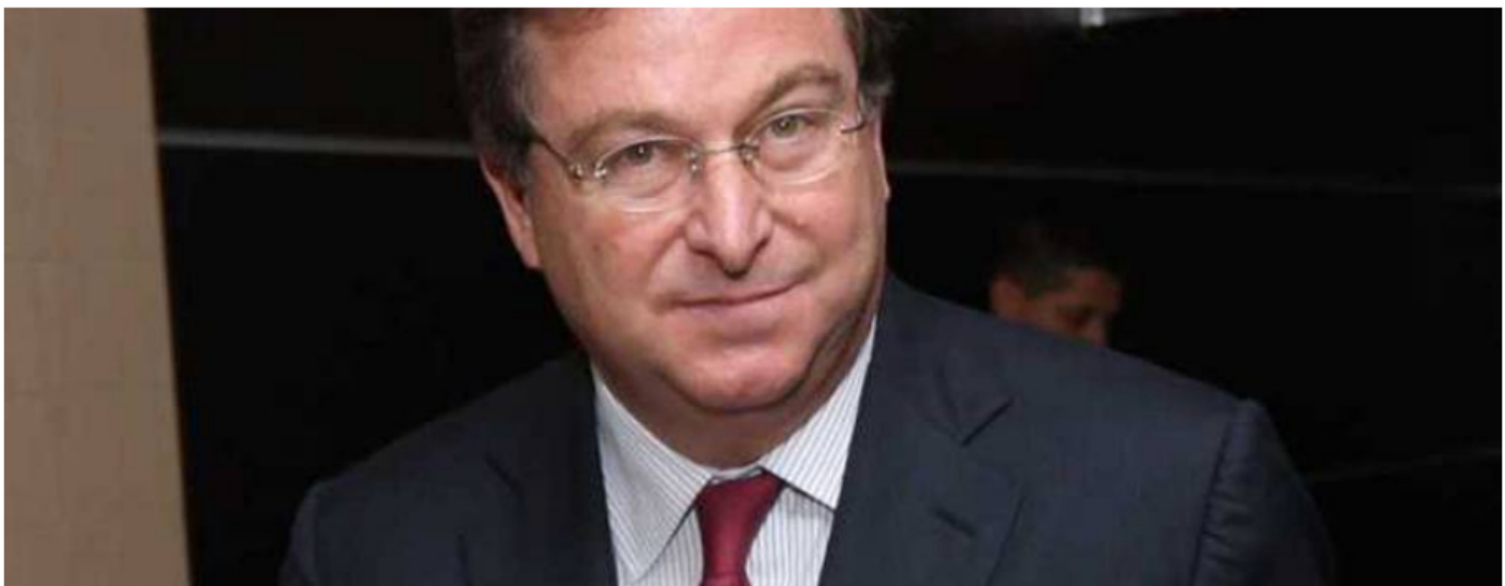
Jaime Gilinski Bacal