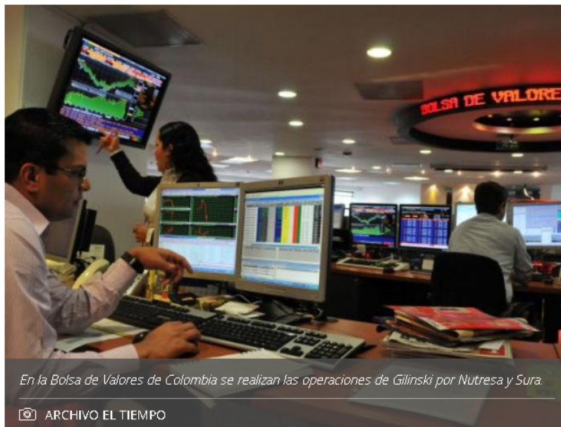
En la Bolsa de Valores de Colombia se realizan las operaciones de Gilinski por Nutresa y Sura.