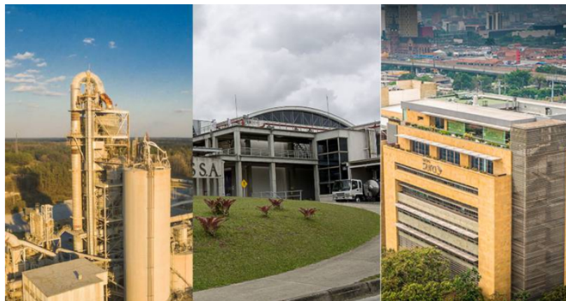
El GEA afrontará transformaciones tras las OPA De izquierda a derecha instalaciones de Argos, Nutresa y Sura, que conforman el GEA.

Además, en La estrategia del día, qué pasará con la acciones tras las OPA, qué dijo Jerome Powell sobre la inflación y cuál es el emprendimiento que está cerca de ponerse el cuerno de unicornio.