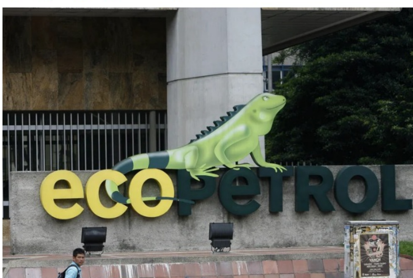
Ecopetrol suspende por tres semanas su actividad en Catatumbo

El nuevo hecho que es investigado aún por las autoridades en Norte de Santander, los trabajadores que desarrollan operaciones en la región informaron sobre el hurto de una camioneta de una empresa contratista de Ecopetrol en Sardinata y la suspensión temporal por tres semanas . Su conductor se encontraba en la estación cuando fue abordado por desconocidos quienes se llevaron el vehículo.