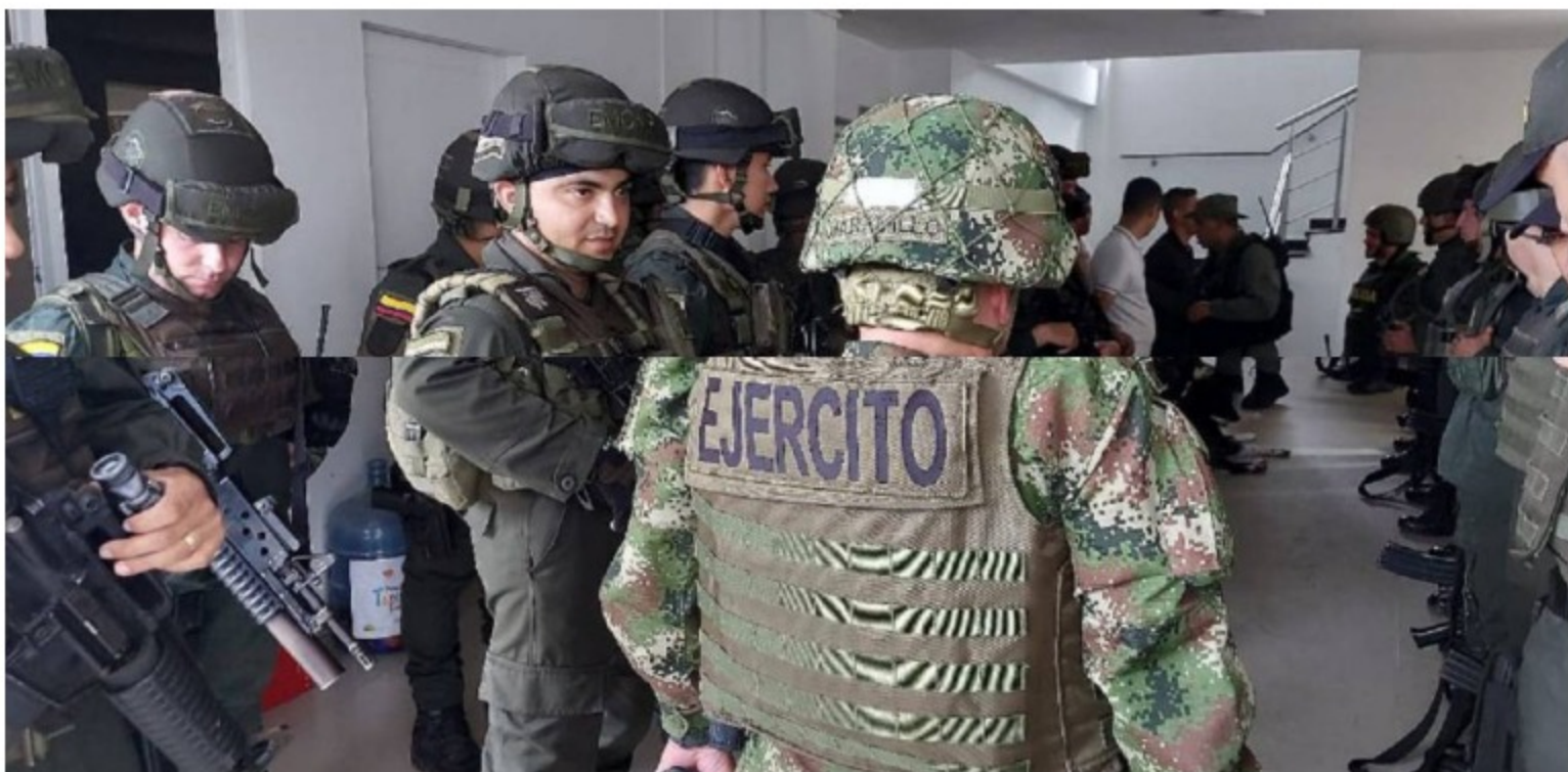
Refuerzan seguridad en Tibú tras hostigamiento contra la fuerza pública