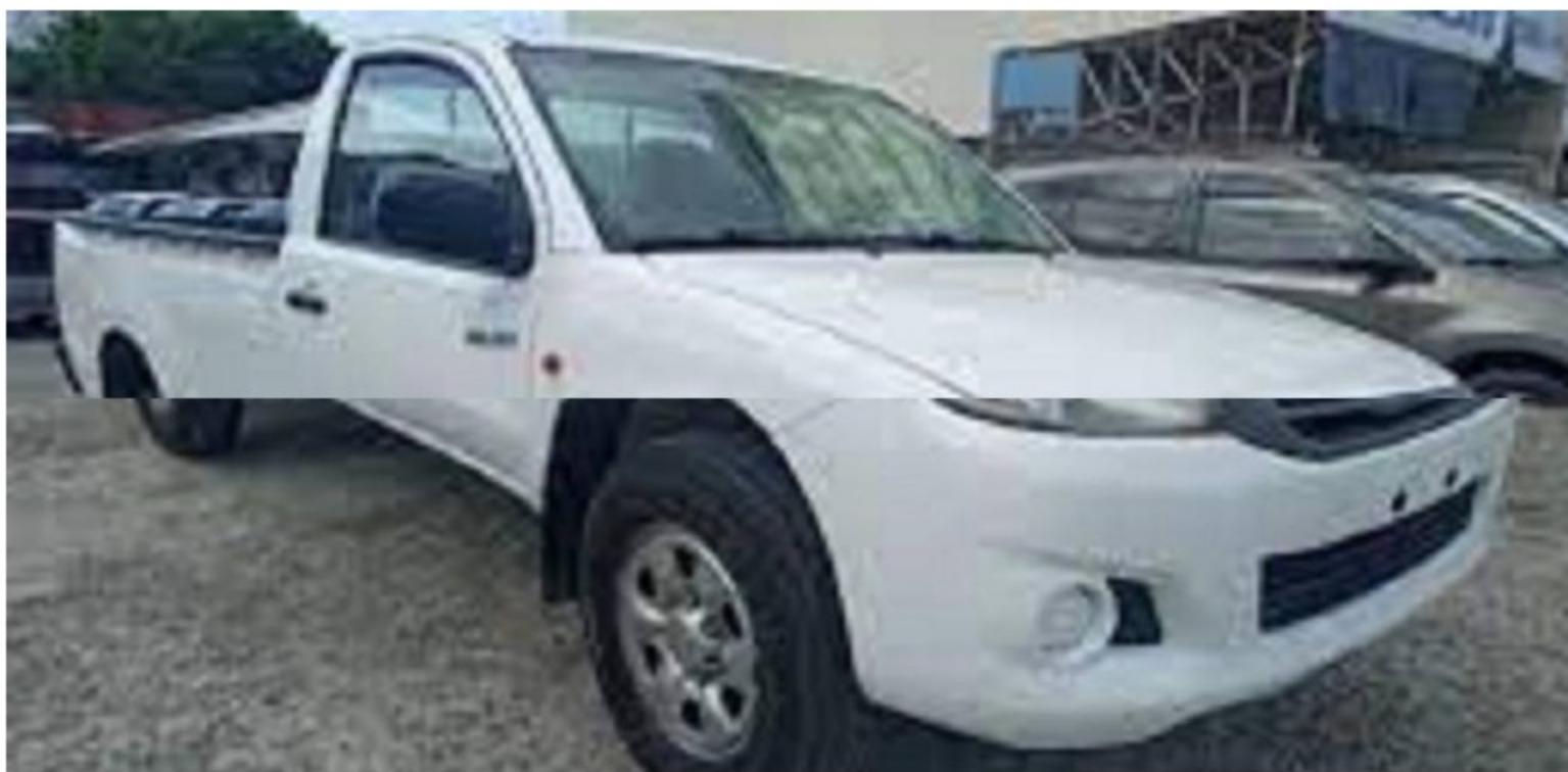
Investigan robo de camioneta de empresa contratista de Ecopetrol

Ecopetrol suspenderá por tres semanas los desplazamientos en esta zona del país.