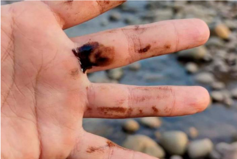
Sonia Suárez / VANGUARDIA

El petróleo proviene de la finca Dos Bocas, cuyos dueños han denunciado por años que un pozo mal abandonado de la 'Troco' estaría causando la situación. Ecopetrol argumenta que se trata de un rezumadero.