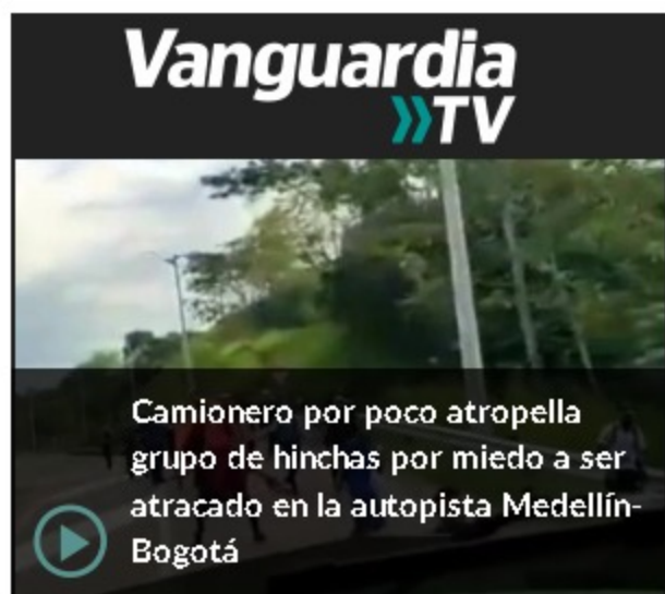
Camionero por poco atropella grupo de hinchas por miedo a ser atracado en la autopista Medellín-Bogotá