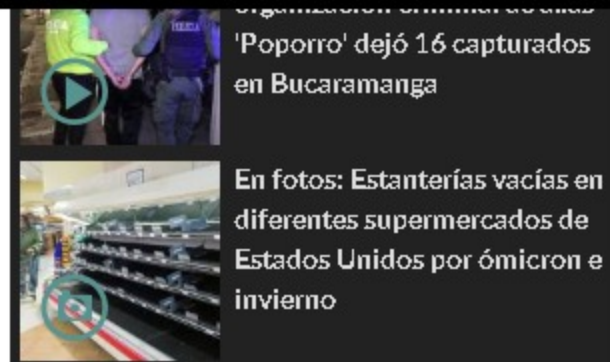
'Poporro' dejó 16 capturados en Bucaramanga En fotos: Estanterías vacías en diferentes supermercados de Estados Unidos por ómicron e invierno