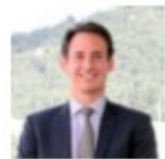
Columna de Juan Pablo Remolina

La prosperidad de los países y de los territorios no la produce la acumulación de tierra, capital o trabajo, como comúnmente sugieren algunas teorías económicas. La prosperidad la genera la productividad que está basada en el conocimiento. Una nación o una región será próspera en la medida en que tenga un ecosistema de ciencia, tecnología e innovación (CTI) capaz de transformar el know-how colectivo en nuevos y más sofisticados productos.