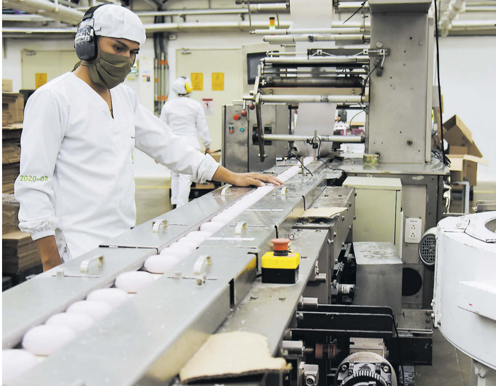
Un trabajador de una compañía que opera en Barranquilla.

Los indicadores del mercado laboral muestran el avance de la recuperación del empleo en Barranquilla y Soledad en el marco del proceso de reactivación. En el trimestre septiembre a noviembre de este año este territorio tuvo la menor tasa de desempleo del país con 9,1 %. La reducción de la tasa de desempleo fue de 3,2 puntos porcentuales frente al trimestre septiembre-noviembre de 2020 cuando el indicador era de 12,3 %. En este periodo, en la capital del Atlántico y Soledad se registraron 887 mil personas ocupadas, unas 45 mil más que en el mismo lapso de 2020.