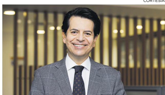
El presidente de la Reficar, Herman Galán.

millón de azufre (ppm) y gasolinas de menos de 50 ppm, que cumplen con los más altos estándares a nivel mundial. "Hemos trabajado para incorporar una mayor participación de crudo nacional en los procesos de producción, que entre enero y septiembre de este año llegó a 83 %", agregó. Recordó que durante la pandemia la demanda se vio afectada por las restricciones a nivel mundial, pero se continuó fortaleciendo el control de costos y gastos, lo que les permitió alcanzar logros en la producción y consolidar la alineación entre la planeación de resultados y la excelencia operativa. "Gracias a la refinería de Cartagena, el país dejó de importar combustibles por USD1.295 millones en 2020 y USD2.014 en 2019. Y el año pasado pagó impuestos por USD30,68 millones, de los cuales USD15,58 millones fueron transferidos a la Nación y USD15,10 millones a Cartagena", destacó. La refinería abastece a la totalidad del mercado de la Costa Caribe y tiene una capacidad de carga de 150.000 barriles diarios. El nivel de conversión es de 97,5 %, es decir que, de un barril de petróleo, ese porcentaje lo transforma en productos de valor y el 2,5 % lo convierte en productos como coque, azufre y arotar.