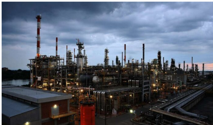
Refinería de Barrancabermeja, Ecopetrol .

El pasado fin de semana (24-25 de diciembre de 2022), el segmento de refinación de Ecopetrol alcanzó una carga de 459.000 barriles por día (bpd), la más alta registrada en la historia de las refinерías de Cartagena y Barrancabermeja.