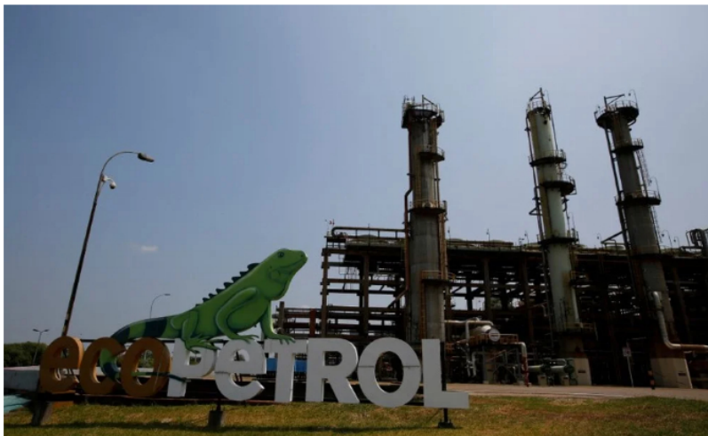
Vista de la refinería de Ecopetrol en Barrancabermeja.

Ecopetrol le sigue dando buenas noticias al país. La empresa estatal informó que el segmento de refinación alcanzó un récord histórico en carga de crudo en sus dos refinerías. De acuerdo con esta, la carga llegó a los 459.000 barriles por día (bpd), la más alta registrada en la historia de las refinerías de Cartagena y Barrancabermeja.