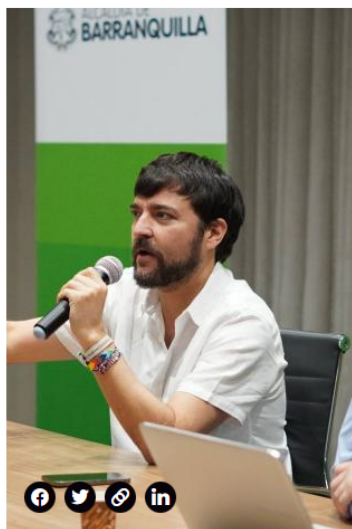
El alcalde Jaime Pumarejo.

(Además: Jorge Robledo sobre tributaria de Gobierno Petro: 'Es una reforma regresiva' )