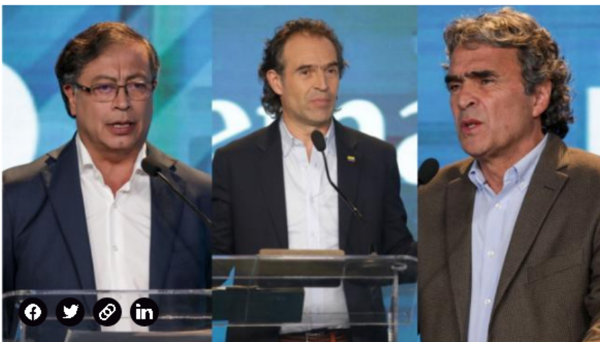
Los candidatos presidenciales, en debate.