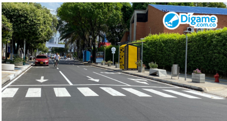
Calle Centenario, Barrancabermeja, Santander