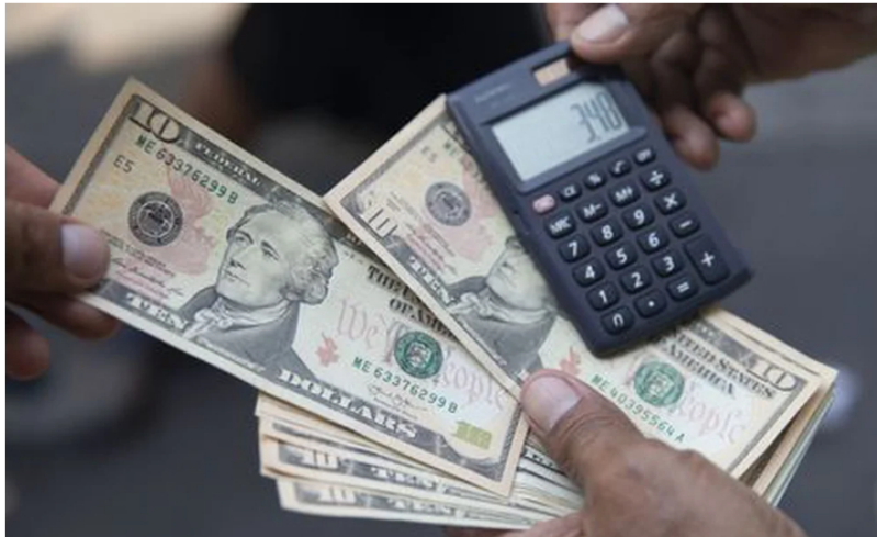
El dólar tuvo registros históricos tras la victoria de Gustavo Petro en las elecciones presidenciales.

El precio del dólar terminó este martes en un precio promedio de 4.767 pesos, tras una considerable alza de 22,62 pesos frente a la tasa representativa del mercado (TRM) , que hoy se ubicó en 4.745,04 pesos, luego de operar el lunes pasado en modalidad Next Day por ser día festivo en Estados Unidos debido a la celebración de Navidad .