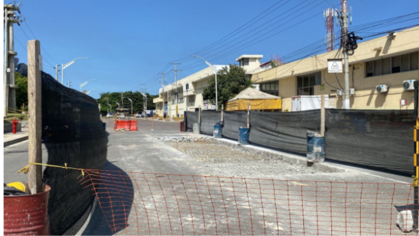
Obras de reconstrucción en la vía 40.

La Secretaría de Tránsito y Seguridad Vial de Barranquilla informó que la vía 40 fue habilitada en su totalidad para el tránsito de vehículos luego de estar cerrada, parcialmente, por el incendio que se registró en una empresa de hidrocarburos.