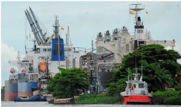
En el puerto de Barranquilla será recibido un barco con gasolina corriente.

Se tiene previsto que llegará una embarcación en la tarde de este lunes. El combustible permitiría proveer a algunas zonas fronterizas del país.