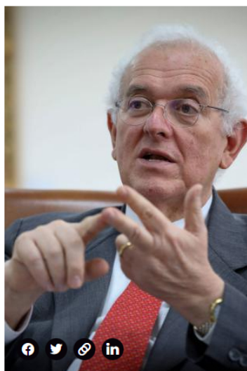
José Antonio Ocampo, ministro de Hacienda de Colombia.

Ese mismo mes, el presidente también hizo un pronunciamiento en el sentido de imponer un control a los capitales que tuvo un impacto fuerte en el mercado cambiario con un encarecimiento en el precio del dólar .