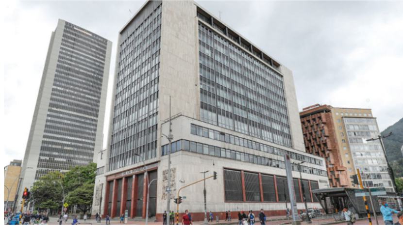
El Banco de la República hizo su primera subida de tasas de interés hasta el cuarto trimestre de 2021, siete meses después de Brasil, el primero en actuar en la región.

La economía colombiana no tiene buena pinta en estos momentos para la prestigiosa consultora Oxford Economics, según la cual la fuerte devaluación del peso frente al dólar y el aumento del riesgo para el país están muy por encima del vecindario. Esto es consecuencia de un problema que comenzó el año pasado, cuando el expresidente Iván Duque no logró aprobar una reforma tributaria en medio de violentas protestas, lo que dejó un agujero en las finanzas públicas, que finalmente condujo a la pérdida de la calificación de grado de inversión de Colombia en mayo de 2021.