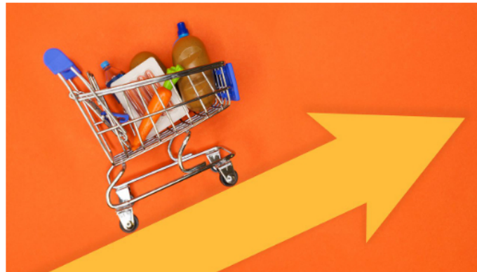
La inflación en Colombia empezó a subir más lento que en otros países del vecindario, por el subsidio a la gasolina. Ahora se cree que se demorará más en corregir.

En Colombia el costo de vida no subió tan abruptamente como en Chile o Brasil por el subsidio a la gasolina, lo que hizo que el Banco de la República se demorara en reaccionar y hacer su primera subida de tasas hasta el cuarto trimestre de 2021, siete meses después de Brasil, el primero en actuar en la región. “Debido a esa demora, el peso ha tenido un desempeño inferior a sus pares y ha impulsado más la inflación, a medida que las importaciones se hicieron más caras”, dicen en Oxford Economics.