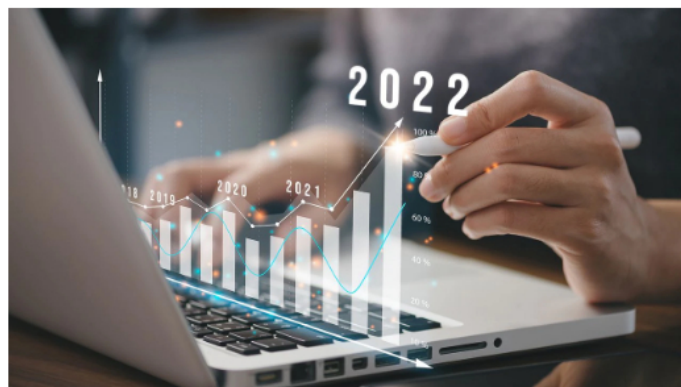
Empresario plan crecimiento en presión y financiero, aumento de indicadores positivos en el año 2022 para aumentar el crecimiento empresarial y un

En la jornada de ayer, este indicador, uno de los más importantes para medir el ambiente de la Bolsa de Valores de Colombia, cerró en 1.227,57 unidades, cediendo de esta forma -1,78 % respecto a las 1.249 que marcaron la referencia. A diferencia de hoy, en ese momento cayó desde su arranque y así se mantuvo hasta terminar con saldo en rojo. Si bien la falta de buenas noticias jugaron en contra en ese momento, en esta oportunidad todo parece ser diferente.