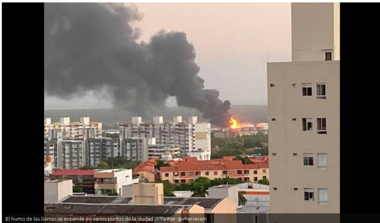
El humo de las llamas se expande en varios puntos de la ciudad.

La ministra de Minas, Irene Vélez, sostuvo que el director de la Ungrd pidió revisar si había plan de gestión de riesgo.