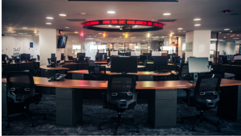
Este no fue un buen arranque para la Bolsa de Valores de Colombia.

La Bolsa de Valores de Colombia y Ecopetrol no tuvieron un buen comienzo de jornada este jueves 22 de diciembre, en la que una vez más amanecieron con fuertes desplomes en sus diferentes indicadores, pese al ambiente de calma que se vive por ahora entre los inversionistas en la recta final de este 2022, donde los flujos de capitales empezaron a ceder y por ahora no se esperan noticias, positivas o negativas, que puedan alterar el curso que han venido tomando las cosas desde la semana pasada en este mercado que nuevamente se aleja de los niveles esperados.