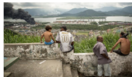
Un incendio en el mayor puerto brasileño continúa después de 24 horas