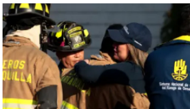
Incendio en depósito de combustible de Barranquilla provoca derrame en el río