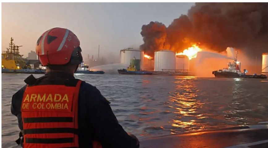
Fotografía cedida ayer por la Armada de Colombia que muestra el incendio en un depósito de combustible junto al río Magdalena, en Barranquilla (Colombia). EFE/ Armada de Colombia