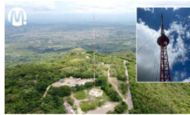
Ecopetrol inició medición de energía eólica en el Huila y Casanare