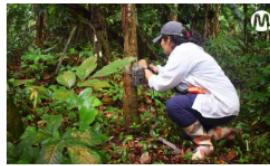
Estudiarán biodiversidad de ecoserva Asa – La Guarupaya, en el Meta