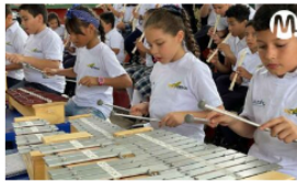
Ecopetrol y Batuta siembran la semilla de la música en niños del Meta