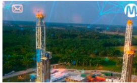
Ecopetrol acumula 15 patentes en Colombia y el extranjero