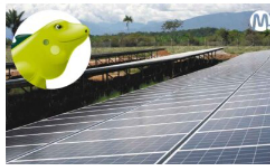
Ecopetrol anuncia billonaria inversión para la transición energética del país