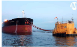
Ecopetrol supera meta de venta de cargamentos de crudo carbono compensado