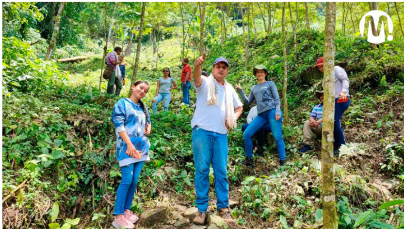
Familias beneficiarias

Además, el campus contempla actividades presenciales como escuelas de campo, visitas de acompañamiento personalizadas y espacios comerciales para los agricultores del Meta.