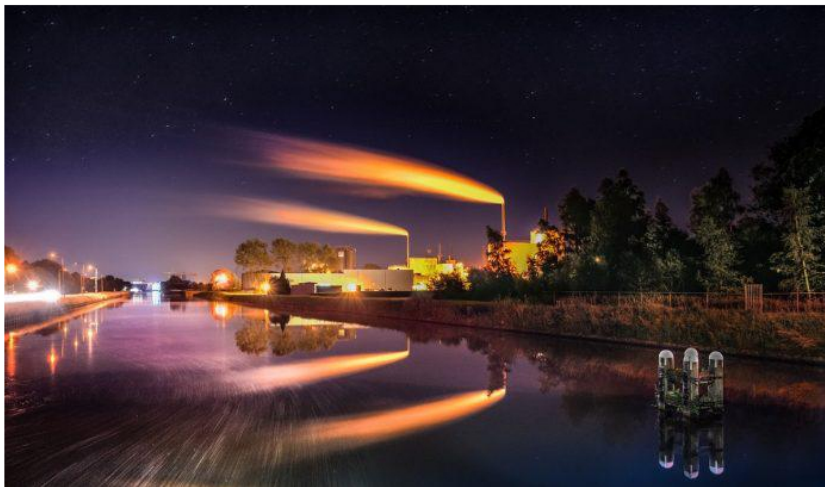
Hidrocarburos, petróleo , gas natural.

La Cámara Colombiana de Bienes y Servicios de Petróleo , Gas y Energía (Campetrol), que agrupa a más de 150 compañías, presentó el Balance Petrolero del tercer trimestre del 2022.