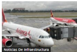
Noticias De Infraestructura

Avianca anuncia tres nuevas rutas para conectar a Medellín y Cartagena con Ecuador