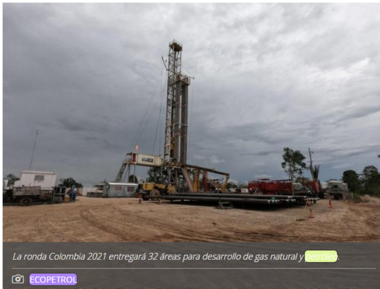
La ronda Colombia 2021 entregará 32 áreas para desarrollo de gas natural y petróleo.

Campetrol señaló que esperan que las cifras sigan mejorando en el corto plazo.