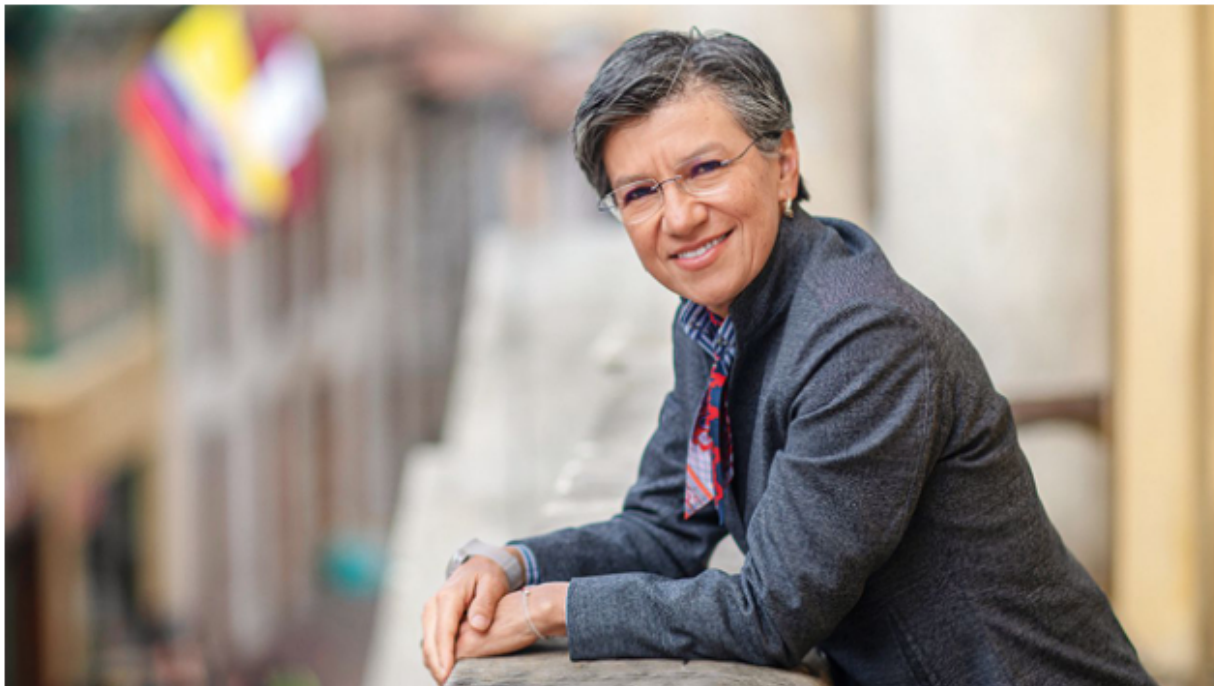
La alcaldesa de Bogotá Claudia López obtuvo una puntuación de 3,1.

El periodista Manuel Salazar realizó su tradicional sondeo de periodistas que publica cada año en el que les pregunta a colegas que cubren la fuente de Bogotá por temas de la capital. Esta vez participaron 33 periodistas que contestaron distintas preguntas sobre temas capitalinos, la administración distrital y políticos de la ciudad. La encuesta es realizada desde hace 21 años.