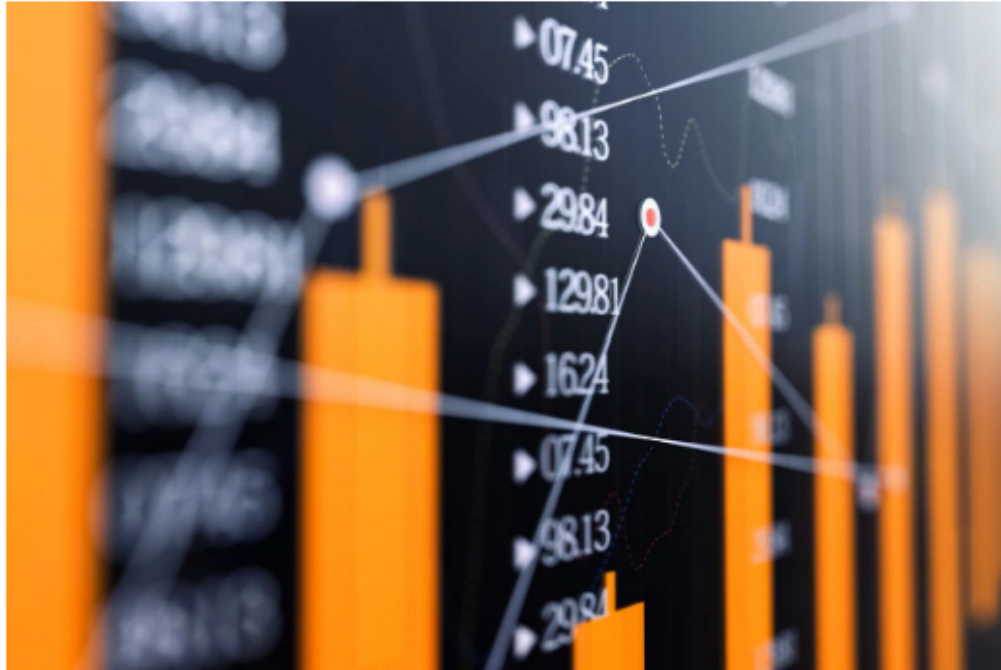
Indicadores económicos

De esta forma, el Colcap mantiene por ahora parte de la tendencia negativa que mostró el pasado viernes, cuando finalizó en 1.211,59 unidades, cayendo -0,89 % respecto a las 1.222 que marcaron la referencia en esa oportunidad. Desde el inicio de ese día este indicador se ubicó en terreno negativo y pese a un par de repuntes que lo llevaron hasta 1.223 unidades como punto más alto, al cierre no logró mantenerse y acabó en los valores ya mencionados.