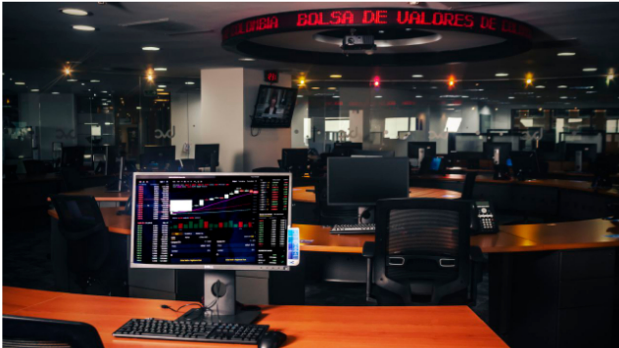
Este fue un arranque dispar para la Bolsa de Valores de Colombia.

La Bolsa de Valores de Colombia y Ecopetrol mantuvieron la racha de malos resultados que traían desde hace varias semanas y este lunes 19 de diciembre arrancaron la semana con indicadores dispersos y una volatilidad marcada, debido al ambiente de expectativa frente a cómo terminará el año este mercado de valores, que por ahora apunta a que completará tres periodos anuales consecutivos con balance en rojo, tal y como se le ha visto desde que la pandemia empezó a afectar la economía mundial.