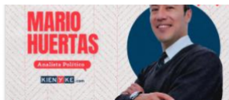
La caída de Castillo como una cuestión de política americana