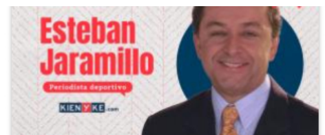
Messi, por no creerse un Dios