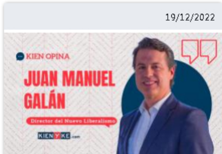
Objetivo: poder absoluto