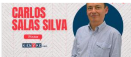
Aquí como allá