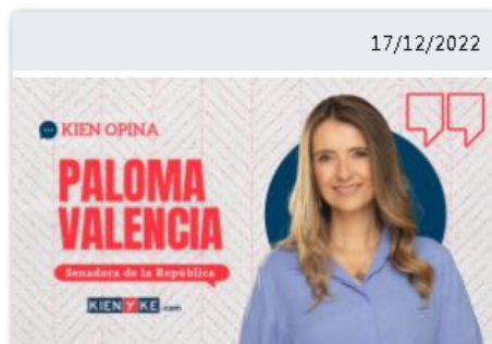
Igualdad: ¿más burocracia o más inversión?