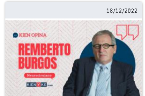
Encefalopatía traumática crónica