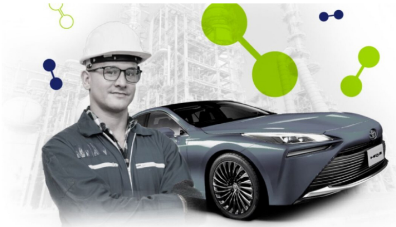
Ecopetrol y Toyota firman acuerdo por 3 años para probar el hidrógeno verde.

Alemania ha demostrado intenciones claras de invertir en minas de carbón y plantas de hidrógeno verde en Colombia, pero los ciudadanos de las comunidades exigen que se respeten sus derechos básicos y medioambientales.