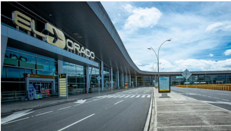
Este jueves 15 de diciembre el Aeropuerto El Dorado hizo un balance de sus indicadores en lo corrido del 2022.

La terminal aérea más grande de Colombia hizo, este jueves 15 de diciembre, un balance sobre el movimiento de carga y de pasajeros que tuvo en lo corrido de 2022, así como de otros reconocimientos que le fueron otorgados en los últimos once meses, y las cifras ya superaron a las que había antes de la pandemia. Así mismo, la entidad indicó que “esperamos terminar el año con más de 36 millones de pasajeros”.