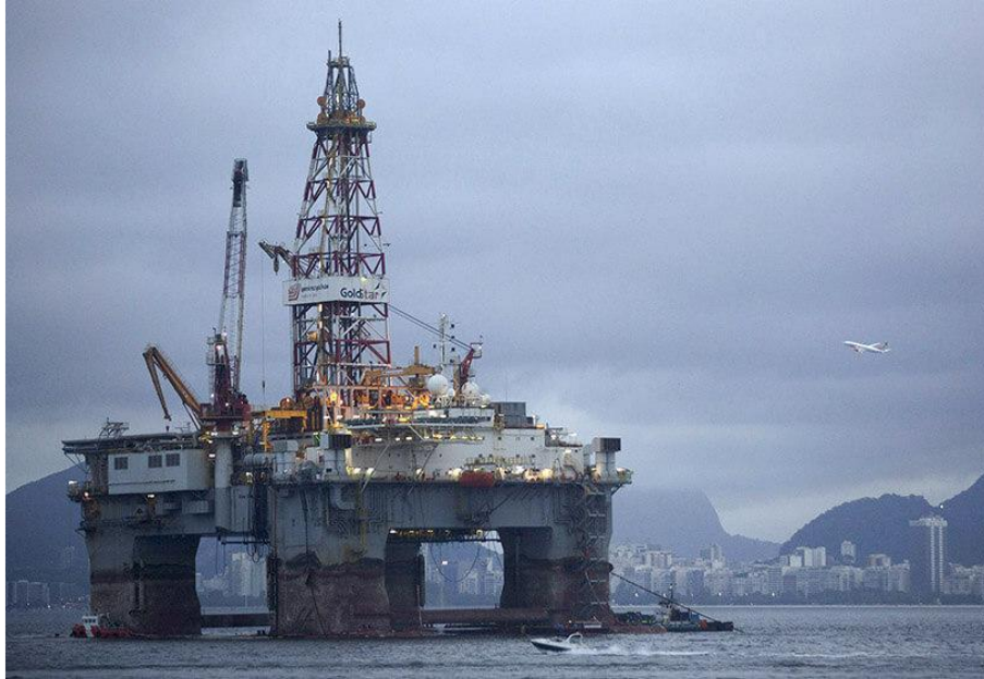
Plataforma petrolífera en las aguas de la Bahía de Guanabara en Niterói, Brasil

Nueve empresas petroleras, entre las cuales las multinacionales BP Energy , Chevron , Shell y Total Energies , se disputarán este viernes en una subasta los derechos para explotar once áreas en las gigantescas reservas del presal, ubicadas en aguas muy profundas del Atlántico frente al litoral brasileño.