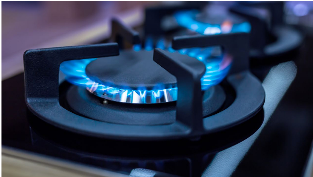
El Atlántico tiene una cobertura de gas natural del 97%.

Este miércoles, 13 de diciembre, culminó en el departamento del Atlántico la primera fase del programa Gas para la Gente. Según informó la gobernadora, Elsa Noguera, la iniciativa permitió beneficiar a más de 6 mil familias.