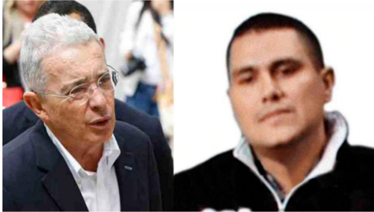
Esta la Uribe enterado de la comunicación entre Cadena y familia de Monsalve

De forma extraña, medios magnéticos con declaraciones relevantes en el proceso que se le sigue al expresidente Álvaro Uribe permanecieron extraviados durante cuatro años.