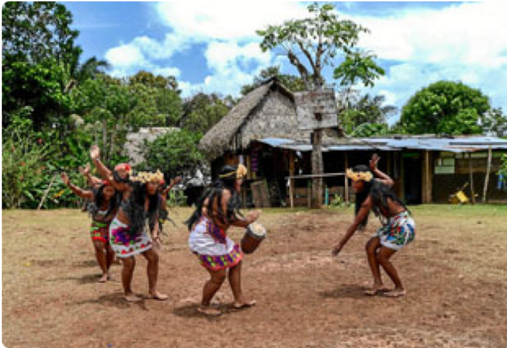
Afectaciones en salud mental